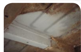
Efter tør isblæsning