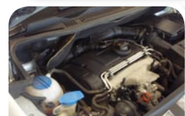
Efter tør isblæsning