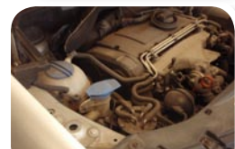
Motorrum før tør isblæsning