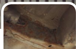
Rust i vognbund